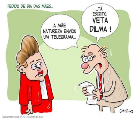
Figuras 2 e 3

Caricatura e charge da campanha “Veta, Dilma” 21