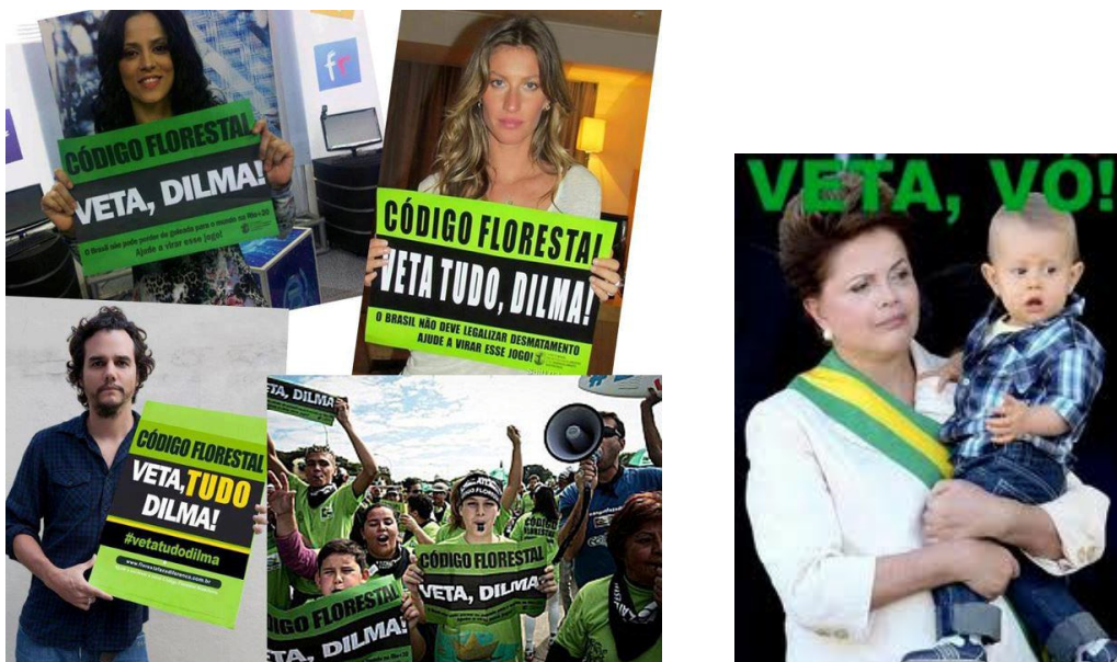
Figuras 4 e 5

Caricatura e charge da campanha “Veta, Dilma” 21