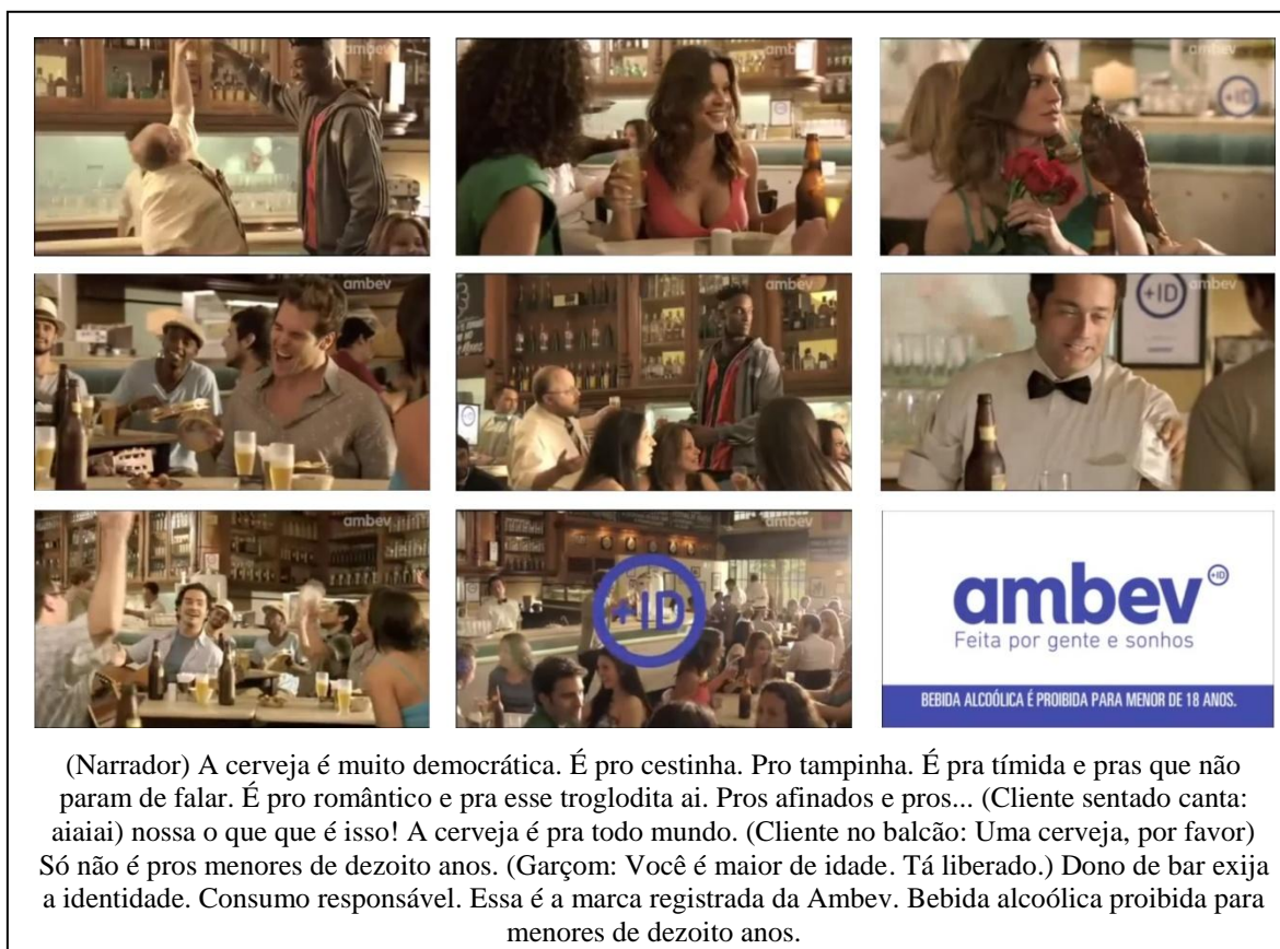
Figura 2: Comercial “Democracia”, da Ambev.

Lançada em setembro de 2011, a campanha da Identidade Ambev foi criada pela agência Loducca, com o objetivo de convidar a sociedade a se engajar no consumo responsável de bebidas alcoólicas. O filme de TV, intitulado "Democracia" (figura 2), foi exibido em canais abertos, juntamente com anúncios em jornais de grande circulação.