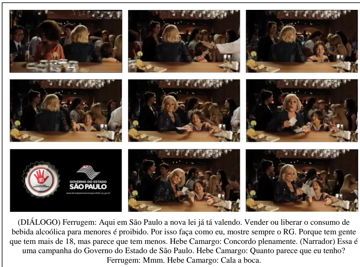
Figura 4: Comercial “Faça como eu, apresente sempre o RG”, do Governo do Estado de São Paulo.

como Hebe Camargo, foi apresentadora de televisão, atriz, humorista e cantora, tida como a “rainha da televisão brasileira”.