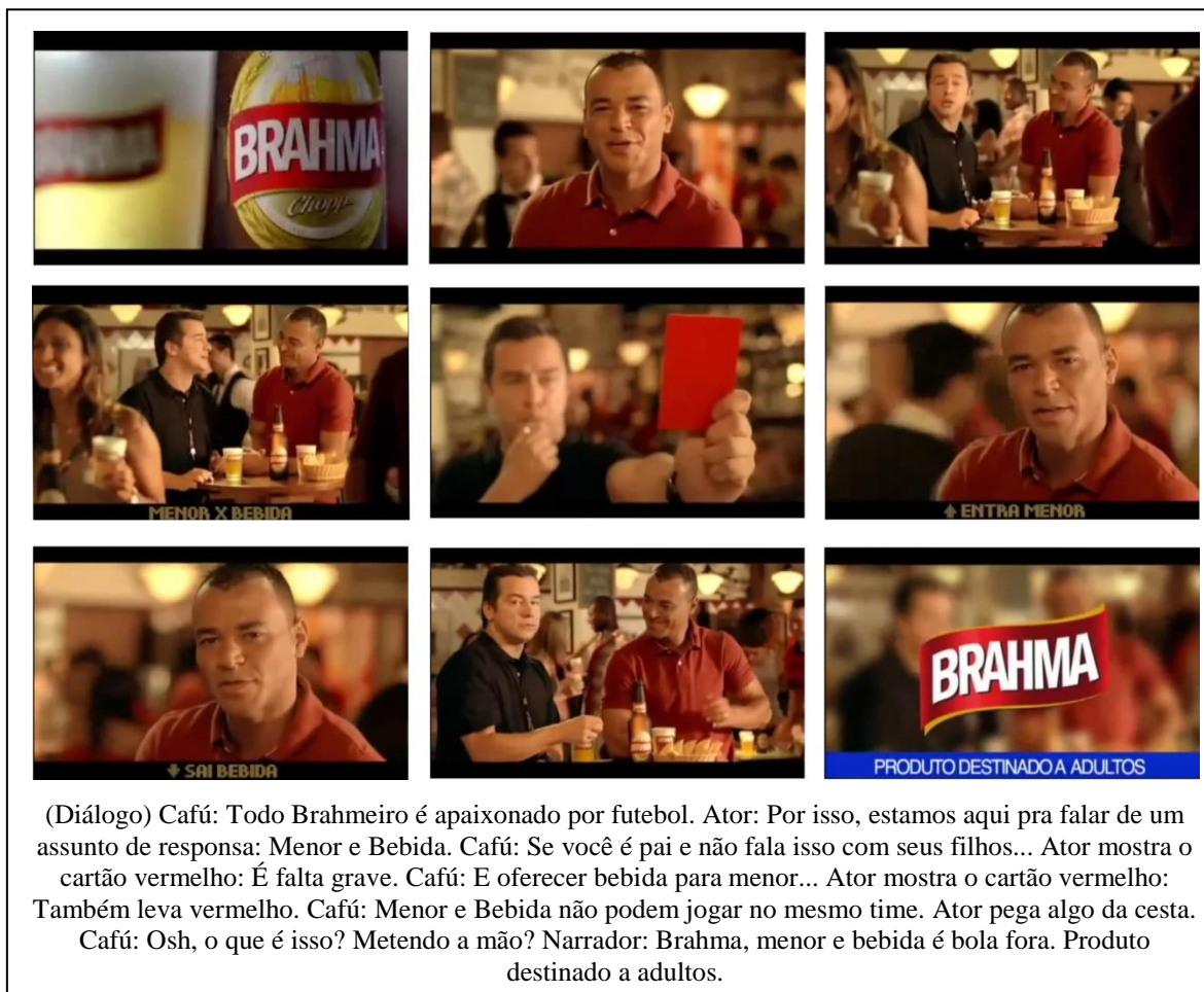
Figura 3: Comercial “Menor X Bebida”, da Brahma.

regulado de bebida alcoólica. Tem como protagonista Marcos Evangelista de Moraes (o Cafú), ex-jogador da seleção brasileira, e o argumento principal do vídeo é que “Menor e Bebida Alcoólica” não “jogam no mesmo time” (TRINDADE; EGI, 2013).