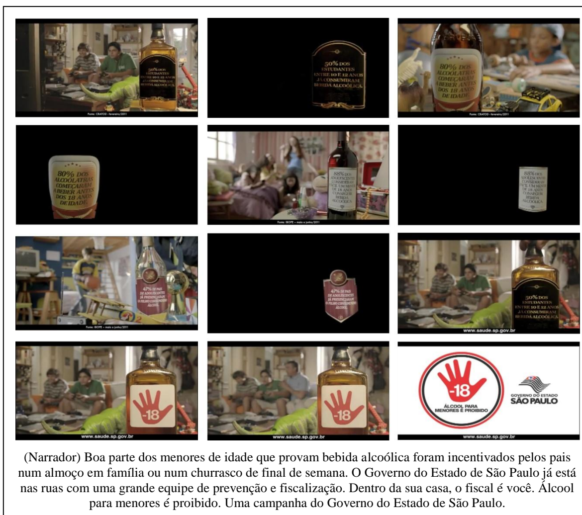
Figura 5: Comercial “Brinquedos”, do Governo do Estado de São Paulo.

consumindo bebidas alcoólicas, mesmo que acompanhados de seus pais ou responsáveis.