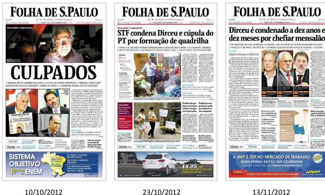
Figura 1 – Julgado e sentenciado

Dois editoriais do jornal Folha de S. Paulo trouxeram questões pertinentes sobre as consequências do julgamento, que ainda levará anos para que possamos respondê-las com precisão. “Os condenados do mensalão devem, é óbvio, pagar pelo que fizeram. Mas não, numa espécie de expiação simbólica, pelas omissões de todo um sistema jurídico e social” ( Folha , 20/10/2012) e “Com a decisão de ontem, como evitar que, no futuro, um STF enviesado se ponha a perseguir parlamentares de oposição?” ( Folha , 18/12/2012), este último fragmento fazendo referência à decisão da Corte de mandar cassar os mandatos dos parlamentares sentenciados, o que gerou protestos por parte de membros do Legislativo.