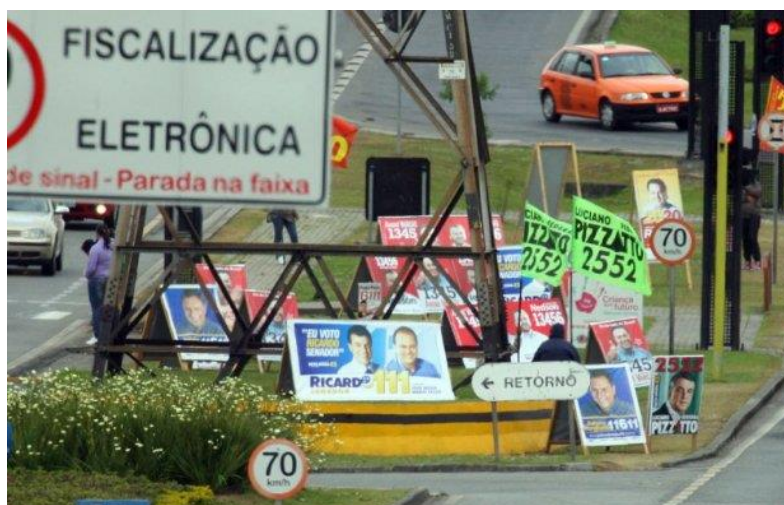
FIGURA 3: Cavaletes de propaganda política – segunda imagem

Fica evidente, pelos princípios da Gestalt, que a enorme quantidade de elementos e a disposição destes elementos, não permite o agrupamento das informações, pois no caso os objetos estão muito próximos uns dos outros, não há unidade entre os cavaletes e a paisagem urbana, nem similaridade e nem continuidade, afetando, com isso, a compreensão, a percepção e a fluidez visual.