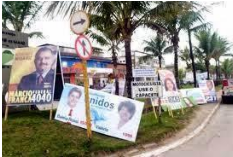
FIGURA 4: Cavaletes de propaganda política – terceira imagem

Por fim, na terceira imagem analisada, vemos algumas árvores na calçada; um poste com duas placas de trânsito em primeiro plano, uma delas indicando o sentido obrigatório e a outra proibindo seguir em frente; e alguns cavaletes de propaganda eleitoral. Embora não exista uma calçada definida, parte dos cavaletes está obstruindo a passagem no passeio público (o que contraria a legislação eleitoral).