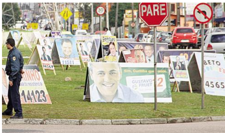
FIGURA 2: Cavaletes de propaganda política – primeira imagem

comentário e nenhum estranhamento em termos de percepção e compreensão das mensagens. Não se tratando, portanto, nenhum limitador da pesquisa.